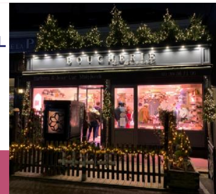
La boucherie d'Auvers

Merci à tous les commerçants pour leur participation !