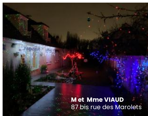
M et Mme VIAUD 87 bis rue des Marolets