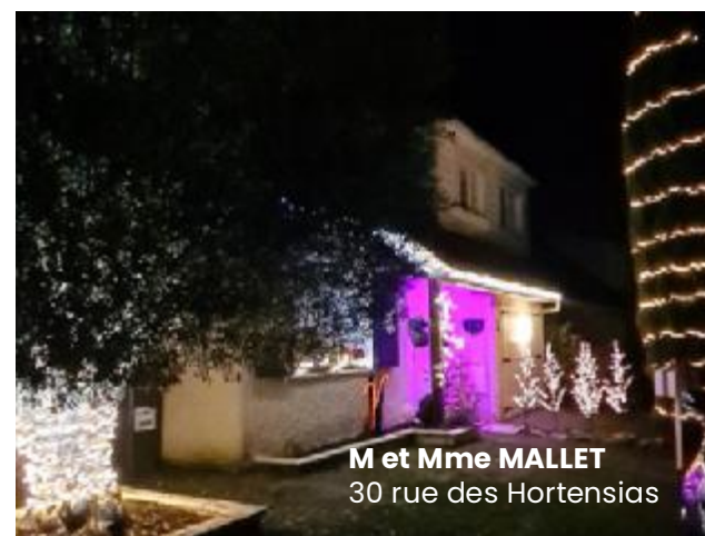
M et Mme MALLET 30 rue des Hortensias