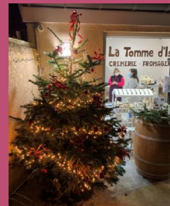
La Tomme d'Isa